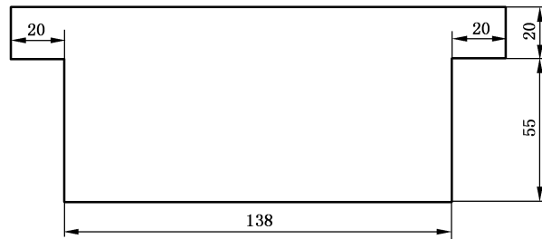
图 2 T 形刮板示意图